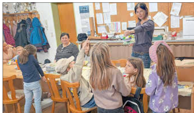
Die NAJU stellt Vogelfutter her